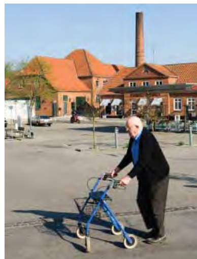
| Hurup. Oplandscenter med privat og offentlig service for det omkringliggende landdistrikt.

Ved siden af de politiske initiativer har forskningsverdenen bidraget med projekter og undersøgelser, der afdækker de mange forandringer og udfordringer, som vore landdistrikter og landsbyer står midt i. Fx er Center for Forskning og Udvikling i Landdistrikter ved Syddansk Universitet kommet med en række erhvervs- og