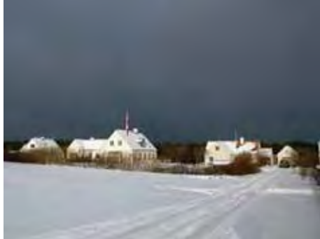
| Hanstholm. Fornyelsen af byen tager også udgangspunkt i kulturmiljøet.