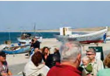
| Nr. Vorupør. Turisme som potentiale for en fremtidig udvikling.

befolkningsanalyser, som påpeger og dokumenterer de økonomiske, sociale og demografiske udviklingstræk.