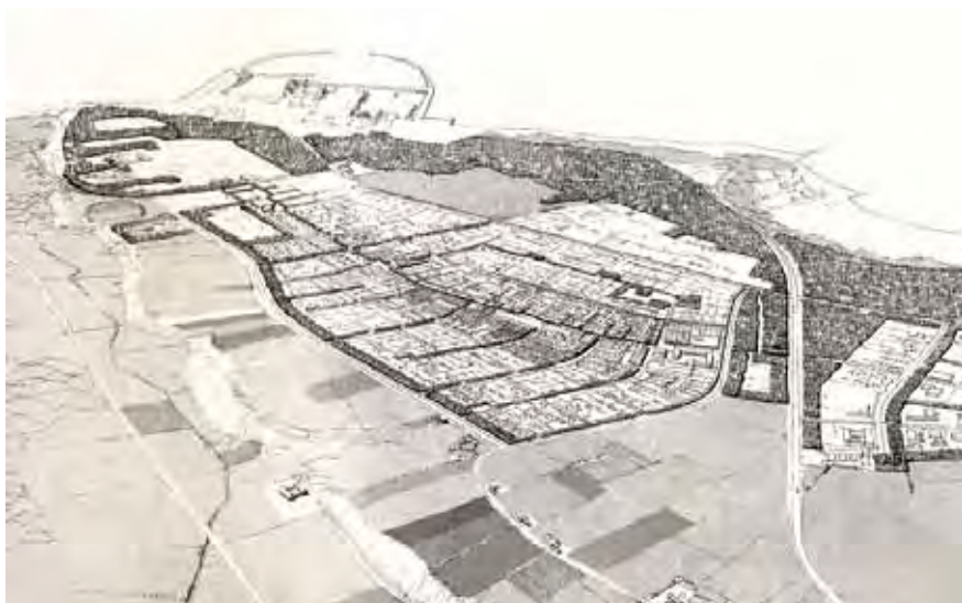
| Hanstholm. Rationalistisk byplanlægning fra 1966.