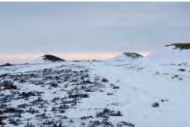
| Bronzealderhøje ved Ydby hede. Nogle af de tidligste kulturhistoriske spor i landskabet i Thy.