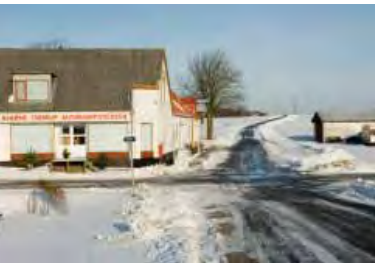
| Vester Vandet. Småerhverv ved en korsvej.

Landskabeligt kan Ny Thisted Kommune opdeles i tre meget forskellige landskabstyper. Hele den østlige del fra nord til syd omfatter det store og frugtbare moræneland. Vest og nord herfor, adskilt af et næsten sammenhængende grønt bånd af plantager, strækker klitheden sig fra Bulbjerg i nord over Hanstholm til Agger i syd. Endelig udgør Vejlerne mod nordøst et helt særegent område, afvekslende mellem våde eng-