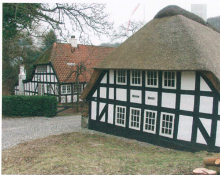
Kjerris Mølle ligger delvis skjult af den opstemmede mølledam.

Af tilsvarende kulturmiljøer skal nævnes de to andre vandmøller i kommunen: Ørnbjerg Mølle og