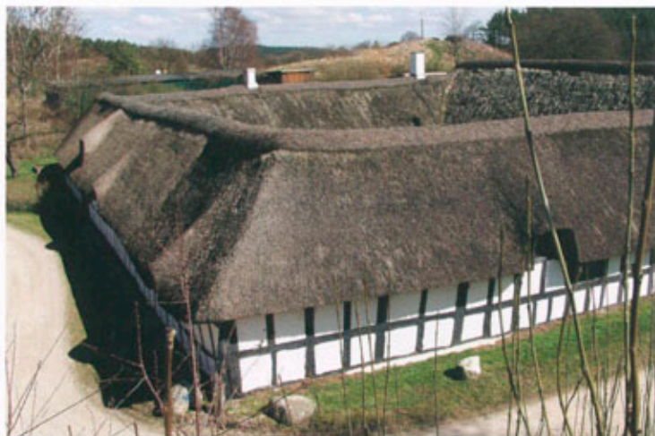
Nedre Strandkær fremstår som et fuldstændigt sluttet firlænget anlæg.

Nedre Strandkær står som et fuldstændigt kvadratisk og lukket firlænget anlæg i sort/hvid bindingsværk og strå på taget. Øvre Strandkær har ikke samme stærke arkitektoniske form, men fremstår imidlertid også som et