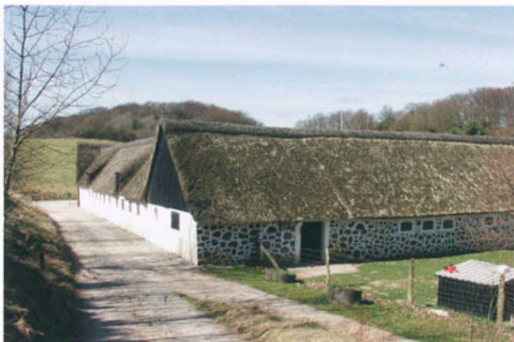
Øvre Strandkær står med sine facader i kalket puds og kløvede marksten.

velproportioneret anlæg med stråtekte tage og facader i kalket puds eller kløvede marksten. Øvre Strandkær ejes af statsskovdistriktet og herfra styres den omfattende naturpleje i området. Nedre Strandkær ejes af Naturhistorisk Museum under Århus Universitet.