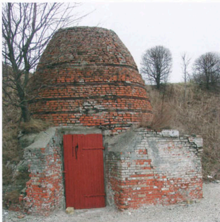
Ved Hoed kalkværk står denne smukke kubeovn fra 1930'erne.

For Ebeltoft Kommunes vedkommende repræsenterer de udvalgte kulturmiljøer følgende temaer, som skønnes at være de vigtigste omdrejningspunkter i kommunens udvikling: Landsbyer (Dejret, Feirup-Stødov, Fuglslev, Hyllested og Knebel med Knebel Bro), hovedgårde (Isgård og Rugård), købstæder (Ebeltoft), landområder (Femøller, Mols Bjerger, Nøruplund husmandskoloni og Vængesø), råstofindvindingsområder (Balle med Birkesig, Hoed og