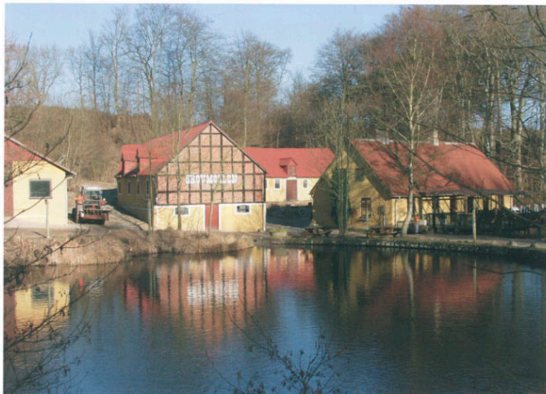
Skovmøllen ligger som den sidste mølle i rækken nederst i Mølleådalene.

vidner om fortidens landbrug. Bortset fra Agri har de sandede jorder kun avlet små landsbyer som Strandkær, Toggerbo og Bogens.